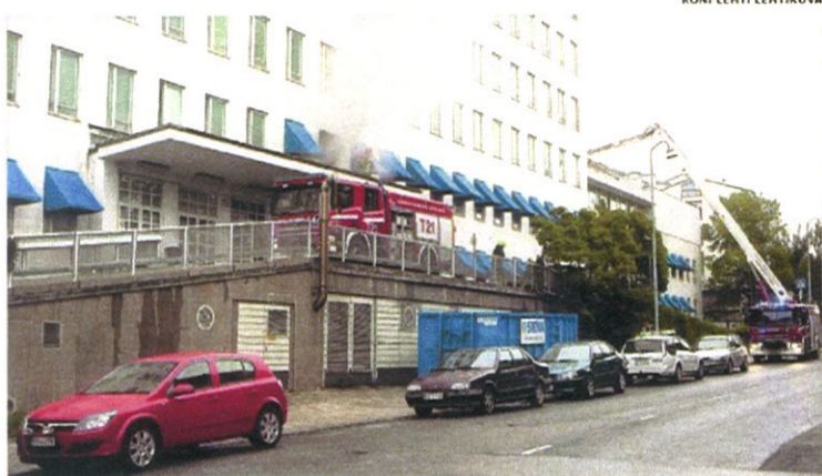
Turun yliopistollisessa keskussairaalassa syttyi tulipalo perjantaina 2. syyskuuta. Rakennuksen kaikki 180 potilasta jouduttiin evakuoimaan, mutta kukaan ei loukkaantunut.